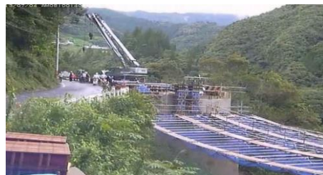
建設現場のリアルタイム監視に