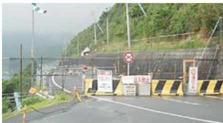
災害発生現場の遠隔観測に