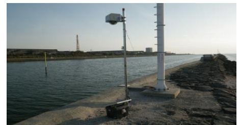
河川・港湾現場の安全管理に